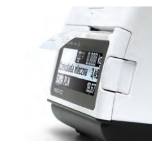
Mechanizm drukujący z obcinaczem