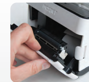
Łatwa wymiana papieru „drop in - wrzuć i drukuj”