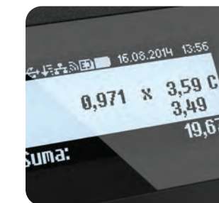
Graficzne wyświetlacze obsługi i klienta

Klawisze funkcyjne oraz 42 klawisze skrótu to bezpośredni dostęp do najczęstszych operacji sprzedażowych, co podnosi komfort użytkownika kasy.