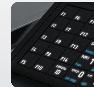
Podświetlana, odporna na zachlapania klawiatura