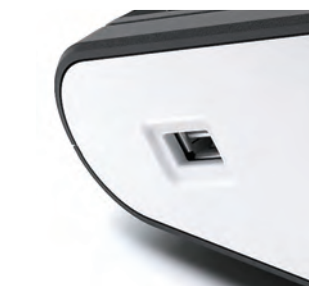
Archiwizacja danych na pendrive