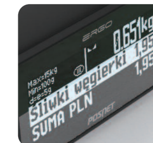
Graficzne wyświetlacze obsługi i klienta

Funkcja programowania przypomnień pozwala, aby użytkownik sam zdecydował, o czym kasa ma pamiętać. We wskazanym czasie urządzenie wydrukuje i wyświetli komunikat i przypomni o ważnej sprawie np. konieczności wykonania raportu miesięcznego, dniu płatności podatku czy urodzinach kierowniczk.