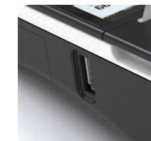
Archiwizacja danych na pendrive, obsługa skanera USB i szuflady